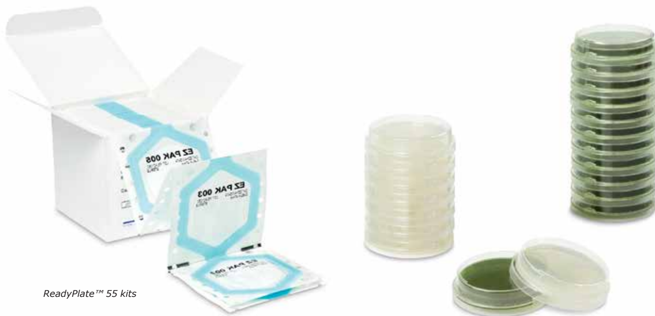
ReadyPlate™ 55 kits